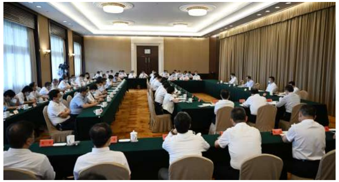
◆ 7月20日,省委书记、省人大常委会主任吴政隆与各民主党派省委会、省工商联领导班子成员座谈。