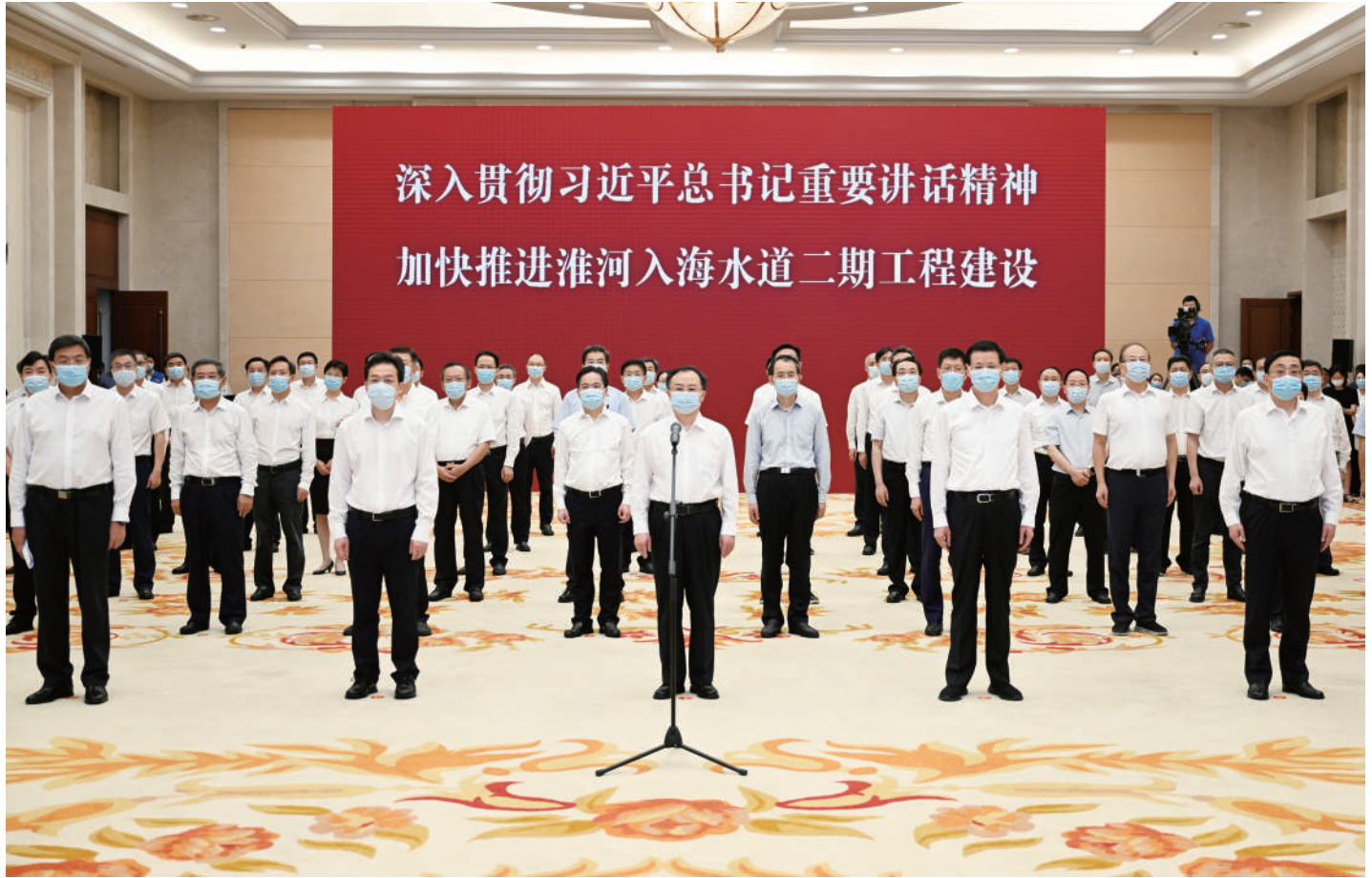
◆ 7月30日上午,新中国成立以来江苏投资额和工程量最大的水利工程——淮河入海水道二期工程开工动员会举行。省委书记、省人大常委会主任吴政隆出席并宣布淮河入海水道二期工程开工。水利部部长李国英、省长许昆林出席并讲话。