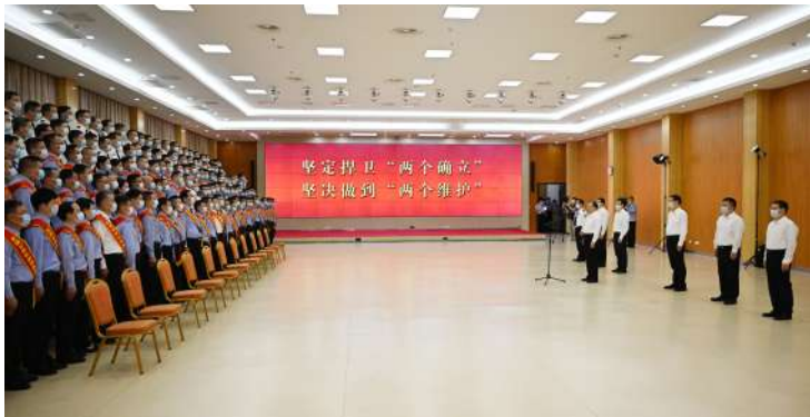
◆ 7月21日上午,省委书记、省人大常委会主任吴政隆会见全省公安功模代表。