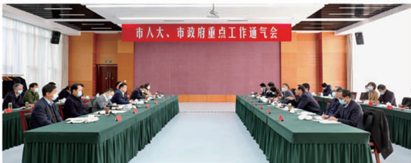
2022年1月17日，市人大、市政府举行2022年重点工作通气会。市长徐曙海出席并讲话。市人大常委会党组书记郭建介绍2022年市人大重点工作。市委常委、常务副市长秦海涛通报2022年市政府重点工作。