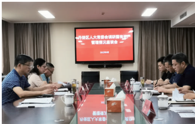
◎ 9月8日,丹徒人大专题调研国有资产管理情况。

部分行政事业单位因历史数据登记不全,产权不明晰、不完整,资金和决算等原因,导致公共基础设施不能予以确认;部分农村道路、桥梁等在移交过程中注重实物移交忽略财务移交,造成公共基础设施未能及时登记,直接影响政府资产与债务匹配,也对专项债使用、项目申请及后续改革产生影响。部分行政事业单位资产因产证不齐,手续补办费用高等原因一直无法盘活利用;部分生产性厂房因年代久