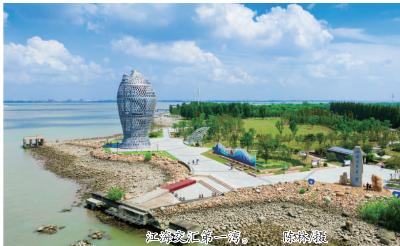
江海交汇第一湾。

“共抓大保护、不搞大开发”的治江理念，不仅是一句口号，也是实现人与自然更好融合的现实命题。因长江具有流域性及水生生物资源流动性的特点，长江禁捕工作需要协同立法来保障，沪苏浙皖三省一市人大常委会首次聚焦长江流域禁捕工作这一“小切口”，同步作出《关于促进和保障长江流域禁捕工作若干问题的决定》。“决定条款并不长，仅有11条，但非常精炼、管用，从决定动议到出台只用了2—3个月，科学划定禁捕区域、构建联合监管工作体系、对违法行为设置相应罚则等，立法的灵活功效得到彰显，充分体现‘小快灵’的立法特点。”2021年4月1日，在沪苏浙皖三省一市人大常委会联合举办的新闻发布会上，相关负责人介绍说。