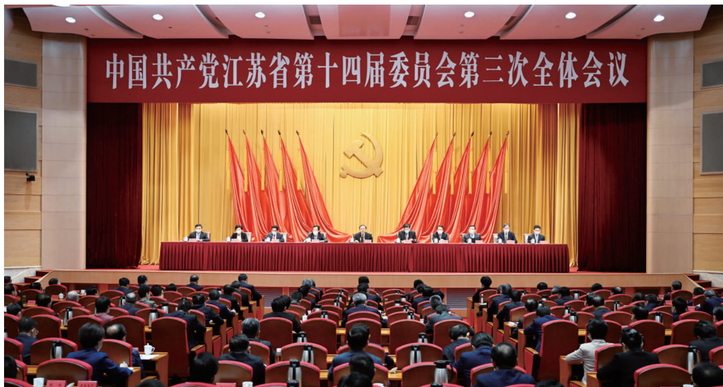
◆ 11月29日,中国共产党江苏省第十四届委员会第三次全体会议在南京召开。全会由省委常委会主持,省委书记、省人大常委会主任吴政隆代表省委常委会讲话。