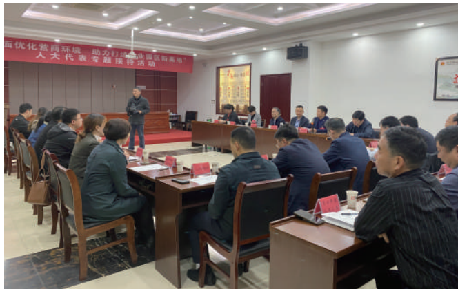
◎ 京口区人大正东路街道工委组织人大代表专题接待活动。

多措并举,推动改革发展环境改善。近年来,京口区人大常委会针对视察调研中发现的问题、代表和选民提出的意见建议,多措并举,多方发力。按照经济发展、民生领域、民主法治等,对政府组成部门分类组织专项评议,适时组织经济部门负责人集中述职评议,让各部门通过对比找差距,强化比学赶超意识,切实担负起正确实施法律法规的职责。先后组织开展优化营商环境专题调研月活动、省保护和促进华侨投资条例、食品安全法、安全生产法执法检查,听取审议法院破产审判、商事审判、检察院服务保障民营经济健康发展、行政执法“三项制度”执行等专项工作报告,促进依法行