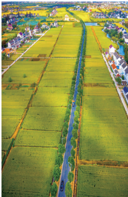
◎俯看最美乡村路。

党的二十大把“发展全过程人民民主”作为中国式现代化的本质要求之一，系统阐述了在全面建设社会主义现代化国家的新征程上发展全过程人民民主、保障人民当家作主的战略部署为地方人大贯彻落实