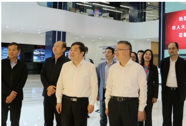
◎无锡市人大开发区委员会专题调研无锡高新区高质量发展情况。

建立市县两级人大开发区委员会。去年1月,全国首个人大开发区委员会在无锡市十六届人大五次会议上依法正式设立,标志着开发区人大工作和民主活动有了法定的专职机构和组织保障,并已成为统筹引领全市做好开发区人大工作,践行全过程人民民主的“新动能”。今年初,结合换届选举,五个设有国家级开发区的市(县)区,依法设立了人大开发区委员会,实现了国家级开发区人大工作组织建设全覆盖,这是全市市县两级人大践行全过程人民民主的生动实践。