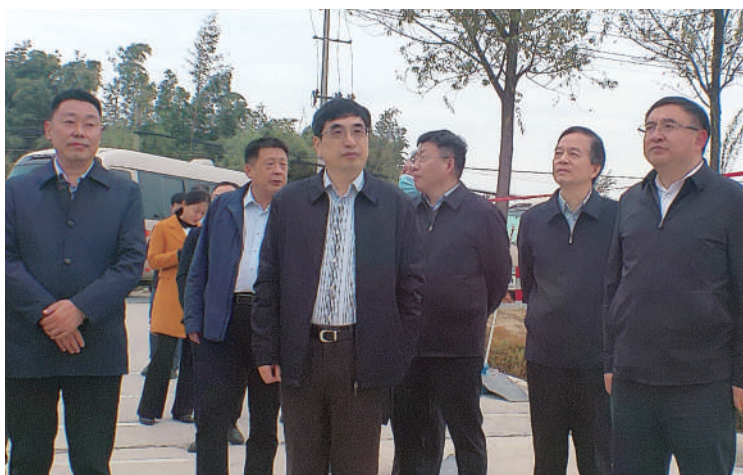
● 11月16至17日,省人大法制委调研组赴淮安开展《江苏省城市市容和环境卫生管理条例(修订草案)》专题立法调研。