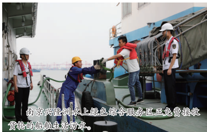
南京兴隆洲水上绿色综合服务区正免费接收货轮的船舶生活污水。

条例对码头供电设施、船舶受电设施建设到后期船舶岸电使用过程中的费用问题均作了具体规定。一