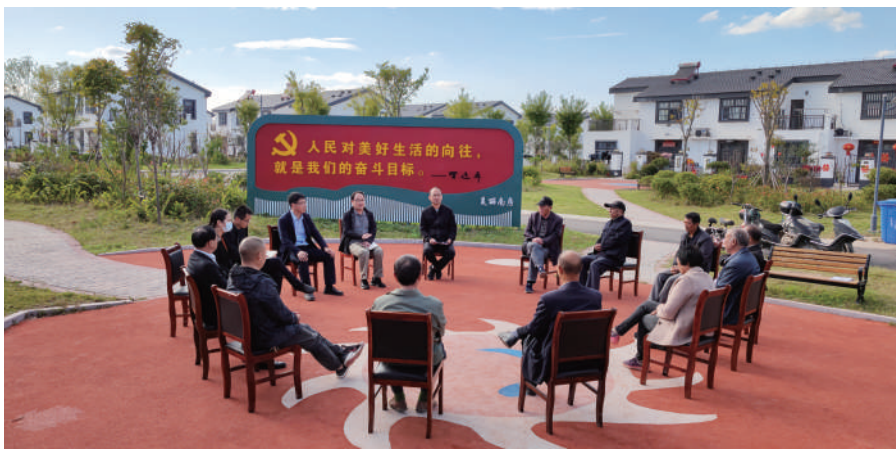
◎灌南县百禄镇南房村,人大代表话民生。

全过程人民民主是社会主义民主政治的本质属性,这是一个归纳性命题,从民主到社会主义民主再到全过程人民民主体现了我们对社会主义民主政治内在规律认识上的深化。“最广泛”主要是指民主在覆盖面上广而全,民主贯穿于选举、协商、决策、管理、监督等各个环节、过程,民主涉及的领域包括政治、经济、社会、文化等全领域,民主覆盖的主体是全体中国人民,这里“最广泛”对应于总书记之前所说的“全过