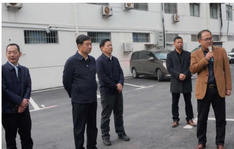
● 11月16至17日,省人大常委会环资城建委调研组赴宿迁,就提升城市安居水平等民生实事项目实施情况开展调研。