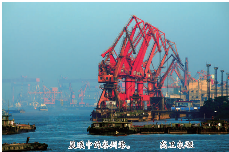
晨曦中的泰州港。

“《长江保护法》明确规定要建立国家长江流域协调机制,但在执法检查中发现,跨区域、跨部门协作机制不够健全、联合执法不够有力,有的地方虽设立了长江办、水升办、河长办、攻坚办等市级议事协调机构,但存在协同配合不够、动真碰硬不强”……省人大财政经济委员会主任委员周铁根率先询问省发改委将采取哪些改进措施落实协调机制。省发改委主任李侃桢不回避问题,直面关键,表示将从三个方面着力改进:第一,完善和落实好省长江办工作机制,将成立长江流域协调机制,更好抓落实抓协同;第二,加强与各议事协调机构的协同配合,建立完善长江流域信息共享机制、协同协作机制,在“长江大保护”上形成合力;第三,落实