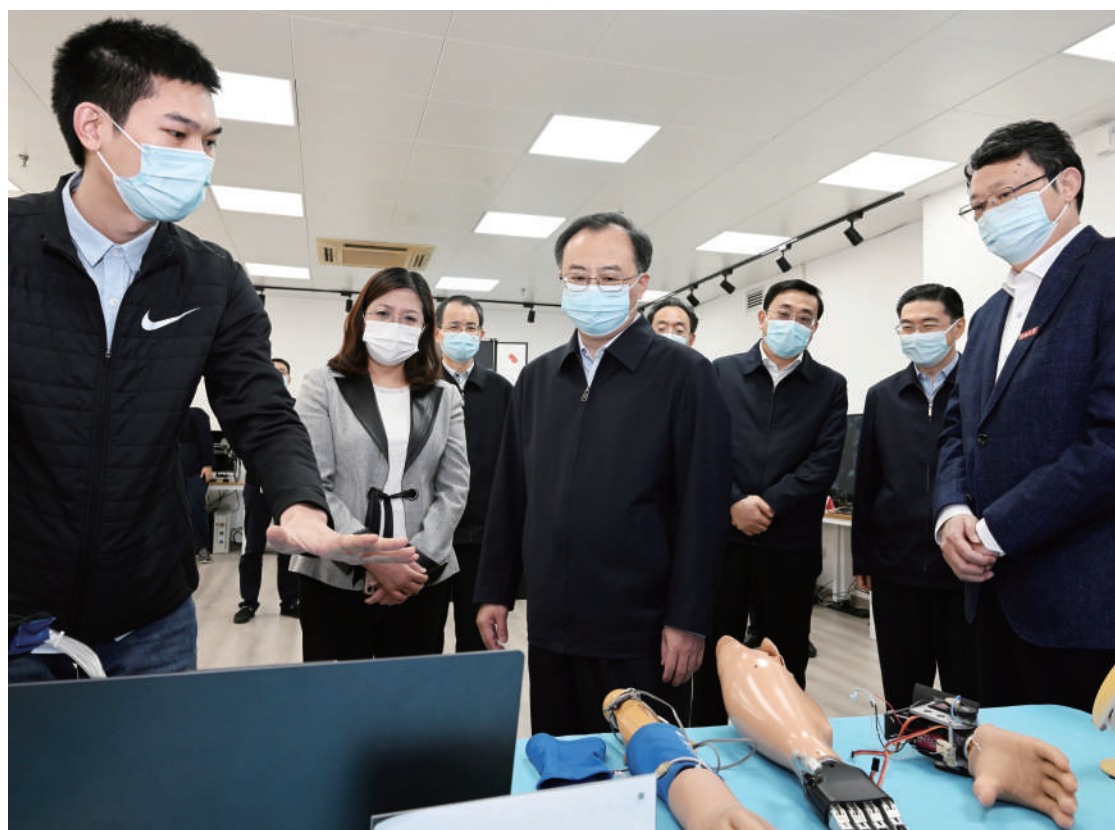
◆ 11月16日,省委书记、省人大常委会主任吴政隆在东南大学宣讲党的二十大精神并调研。