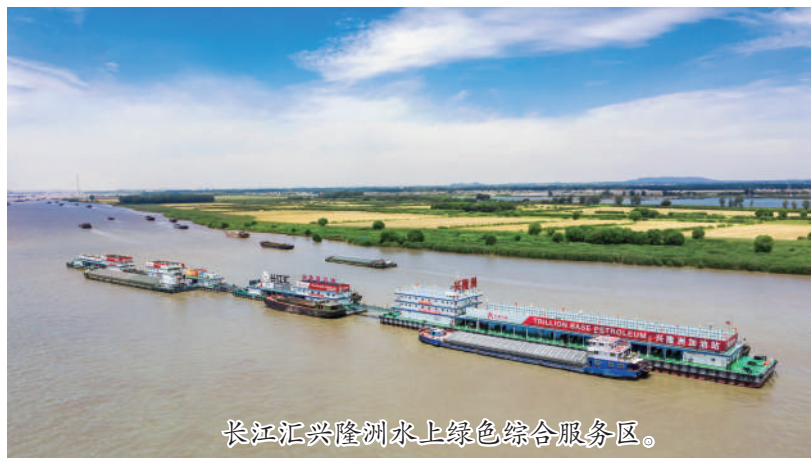
长江汇兴隆洲水上绿色综合服务区。

制定条例是贯彻落实习近平生态文明思想的需要。推动长江经济带发展是以习近平同志为核心的党中央作出的重大决策,是关系国家发展全局的重大战略。习近平总书记高度重视长江生态保护工作,提出