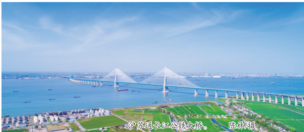
沪苏通长江公铁大桥。

历史长河中,长江文化已成为中华民族的基因,涵养着人们的精神世界。今年1月,长江国家文化公园建设正式启动。4月,江苏出台《长江国家文化公园江苏段建设推进方案》,提出到2025年将基本完成长江国家