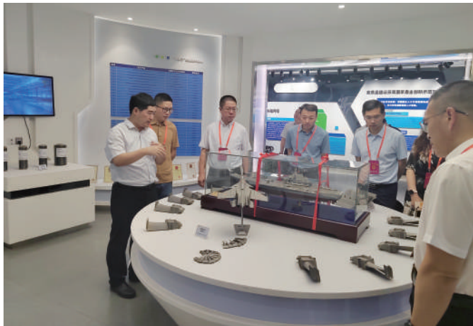
◎ 6月14日，丹阳市财经行业人大代表视察科技发展专项资金管理情况。

突出“准”，把握决算审查工作关键点。部门决算主要审查贯彻落实市委相关决策部署的具体情况、部门决算与预算差异情况、预算执行增减变动情况、部门重点支出项目的资金使用及绩效实现情况、部门结转结余资金情况、部门预算管理制度建设和执行情况、五项经费使用情况和上年度审计查出问题整改情况和部门预决算公开情况。重点支出项目决算主要审查贯彻落实市委相关决策部署情况、决算与预算差异情况、预算执行增减变动情况、绩效目标实现情况、资金管理制