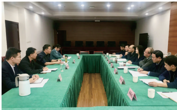
◎ 10月13日,润州人大调研区属企业国有资产管理情况。

接续监督“见实效”。润州区人大常委会始终把注重监督实效,强化监督落实,提升监督质量,将监督进行到底作为重要抓手,接续推进国有资产管理