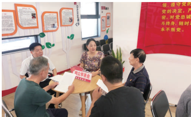
◎靖江市人大代表在“群众早茶会”上接待选民,倾听民声为民解忧。

力推“有商有量”深度互动。 开展“学习宣传贯彻二十大 千名人大代表进万家”活动,让全市近千名五级人大代表联系上万名群众。活动中所有事项从动议到实施,必须由群众出题、请群众献策、让群众评判,扩大人民群众有序政治参与,把源自民意、反映民意、实现民意贯穿主题活动全过程,持续擦亮主题活动这一名片,谱写全过程人民民主的靖江篇章。 (范敏)