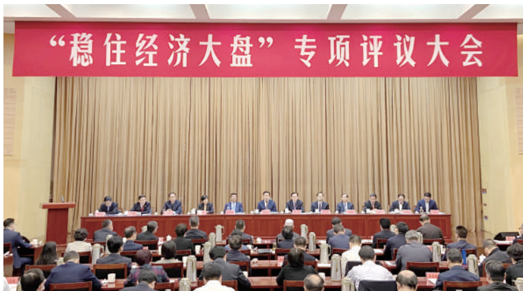
◎ 10月31日,镇江市人大常委会举行“稳住经济大盘”专项评议大会。

为了评出实效、解决问题,此次专项评议大会把询问作为会议主要环节,对10个部门工作现场进行